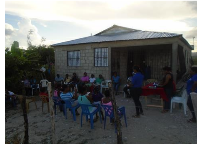
Encuentros con miembros Juntas de Vecinos