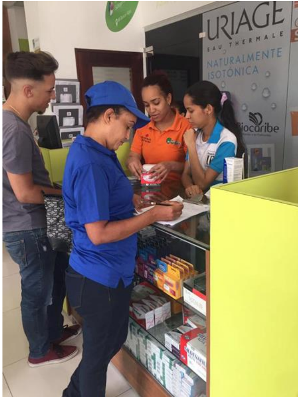
Visitas a Comerciantes y Empresarios