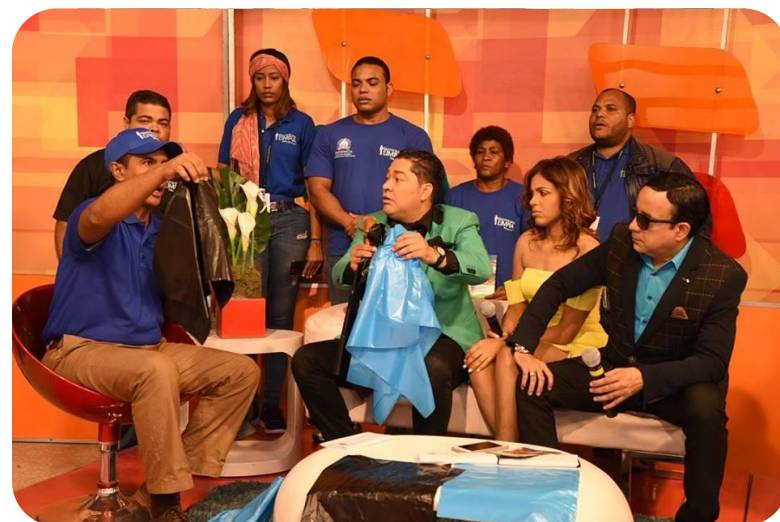
Participación en el Programa del Pachá.