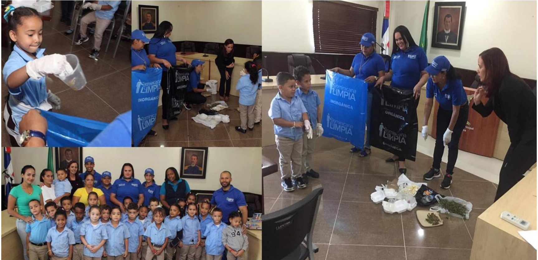
Encuentros con niños de diferentes centros educativos