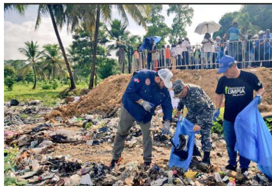
Director de Autoridad Portuaria