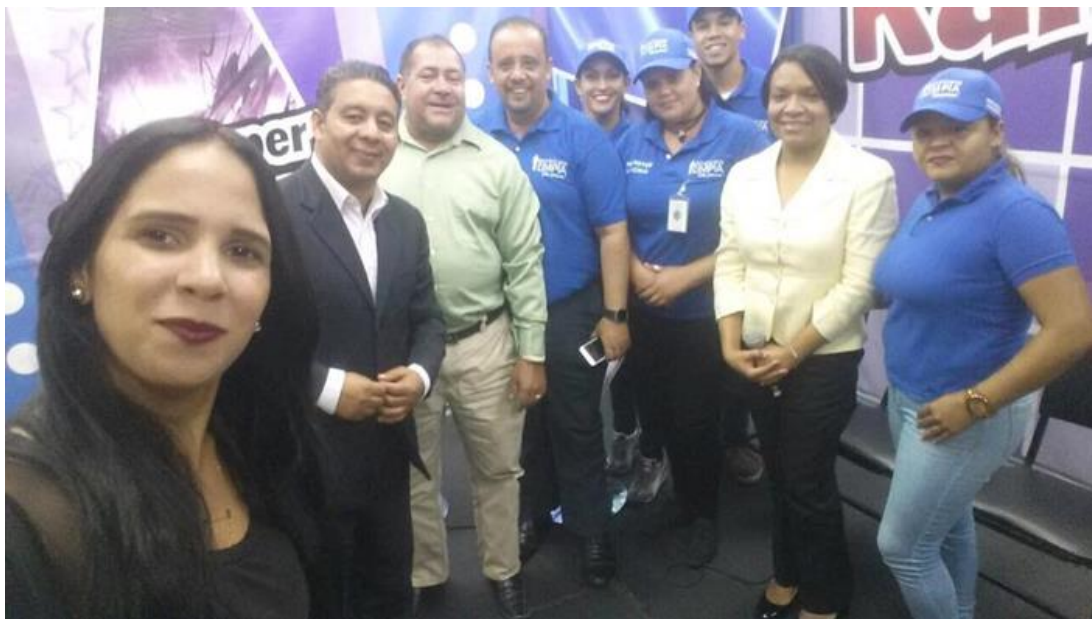
Encuentros con Medios de Comunicación