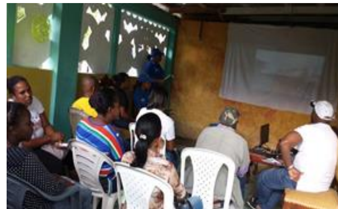
Encuentro con representantes de Juntas de Vecinos