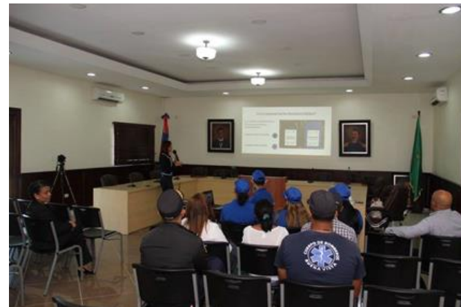
Encuentro con representantes de Instituciones Públicas