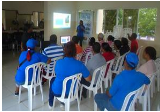
Sensibilización del personal municipal sobre DL