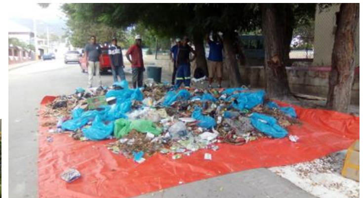
Realización de Estudio de caracterización de los residuos sólidos