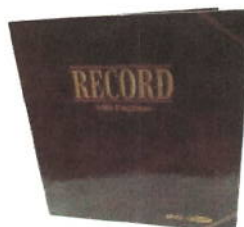
16 LIBRO RECORD 300P