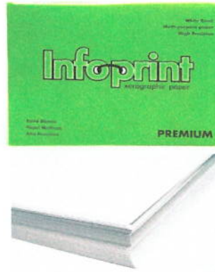
2 PAPEL 81/2X14