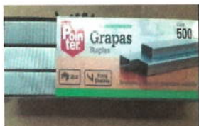
9 GRAPAS STANDART