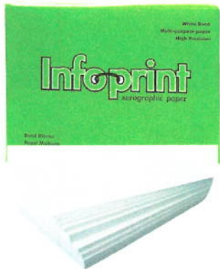
1 PAPEL 81/2X11