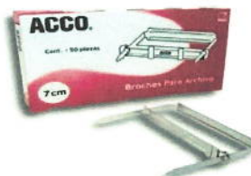
14 GANCHOS ACCO