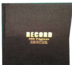
15 LIBRO RECORD 500P