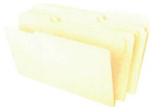
3 FOLDER 81/2X11