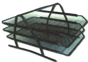
13 BANDEJAS 3/1 METAL