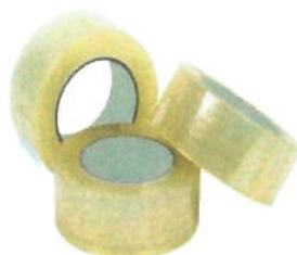
12 CINTA ADHESIVA 2X100