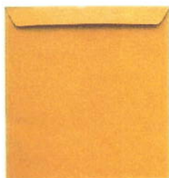
17 SOBRE MANILA