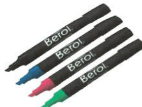
6 MARCADORES PERMANENTES